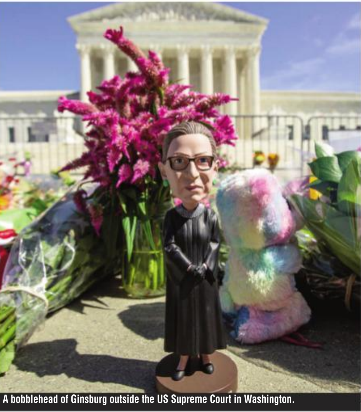
A bobblehead of Ginsburg outside the US Supreme Court in Washington.